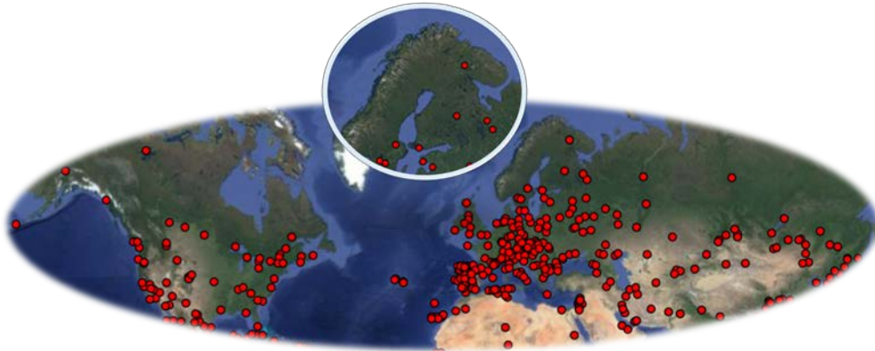
Kuva 1. Biosfäärialueet painottuvat keskiselle pallonpuoliskolle.

Keski-Suomen ja Hämeen maakuntien aiemmat ympäristökeskukset ovat selvittäneet Päijänteen biosfäärialueen perustamisedellytyksiä yhteisessä kehittämishankkeessa vuosina 2007-2008 (Päijänne - kansainvälinen luonto- ja kulttuurimatkailukohde). Hankkeessa laaditussa selvityksessä todettiin, että alue täyttää Unescon asettamat kriteerit biosfäärialueelle ja alueen visioksi laadittiin seuraava (Uusitalo ym. 2008):