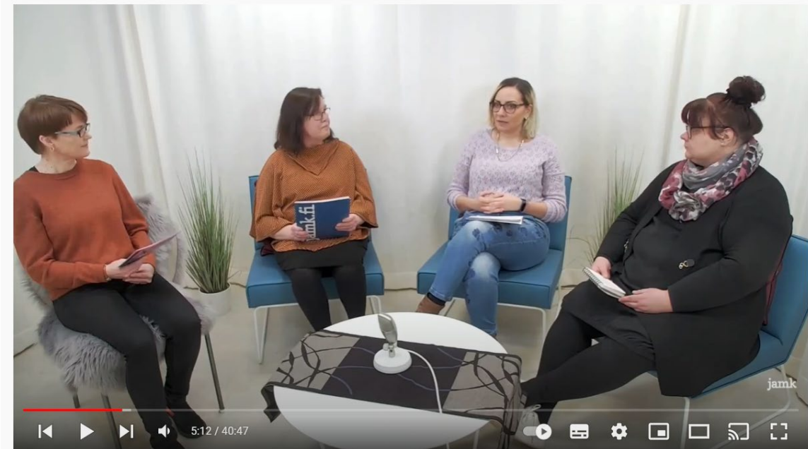
Havaintoja vapaaehtoismatkailusta Suomessa ja Keski-Suomessa