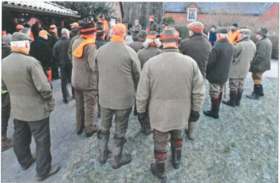
Jahti, jossa on paljon osallistujia, vaatii runsaasti panostusta muun muassa turvallisuuteen.

Saaliiksi saatiin yhteensä 46 hirvieläintä, siis 15,5 hirvieläintä tuhatta hehtaaria kohti.